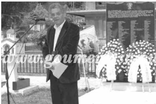
«Ζητούν δικαίωση τα θύματα της γενοκτονίας. Θεωρούμε ότι είναι χρέος μας να τιμούμε εκεί-